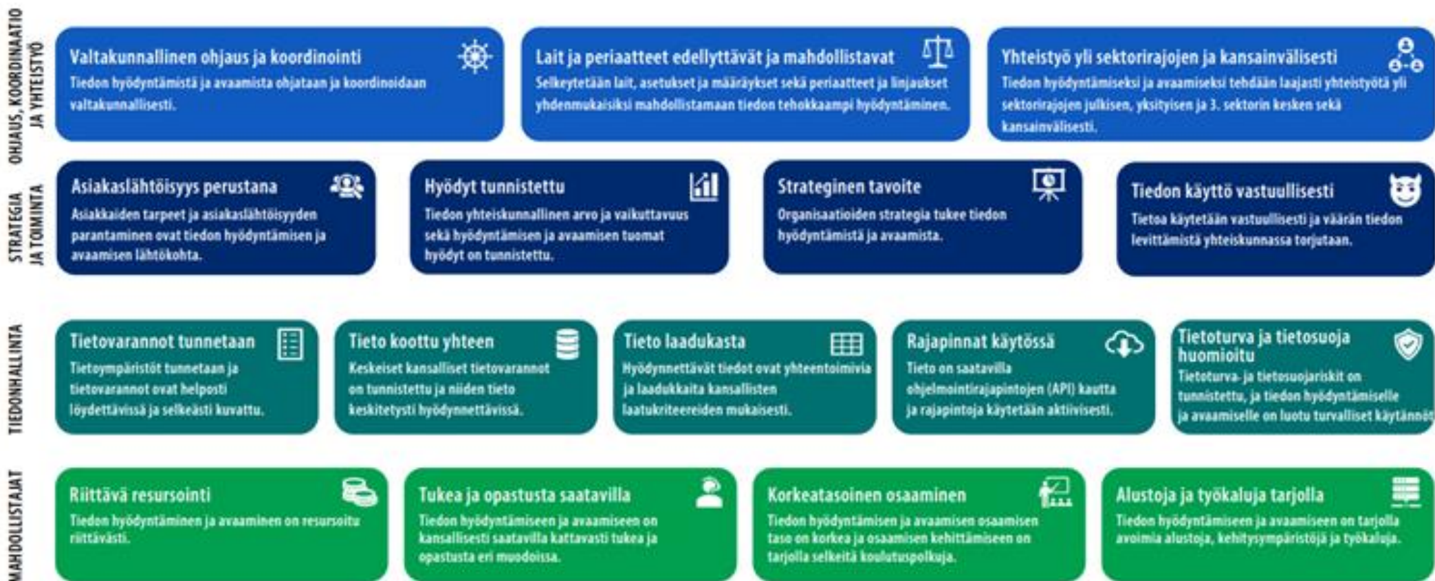
Kuva 1. Tietopolitiikan strategiset tavoitteet – kohti kattavaa tiedon hyödyntämistä ja avaamista.