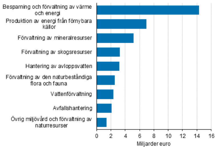
Figurbilaga 1. Omsättning inom miljöaffärverksamhet 2019, miljarder euro